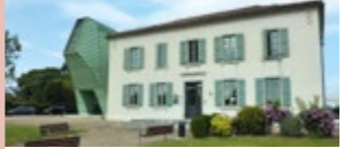
Maison de la céramique contemporaine De juin à septembre Tél. : 05 58 79 65 45